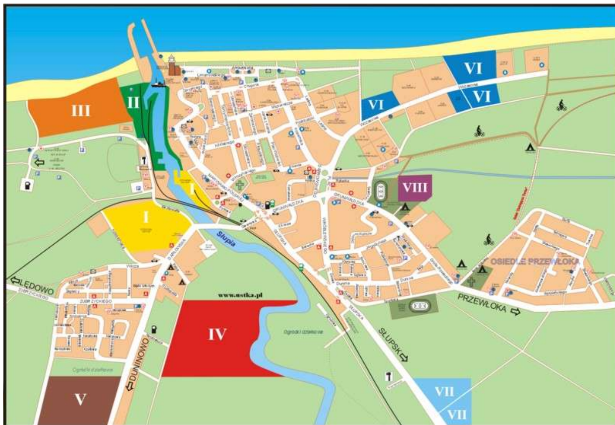
Rys. Tereny inwestycyjne Gminy Miejskiej Ustka

W Gminie Miejskiej Ustka znajdują się atrakcyjne wydzielone tereny inwestycyjne. Są to tereny położone w różnych częściach miasta, w pełni lub częściowo uzbrojone, o dobrym dostępie komunikacyjnym.