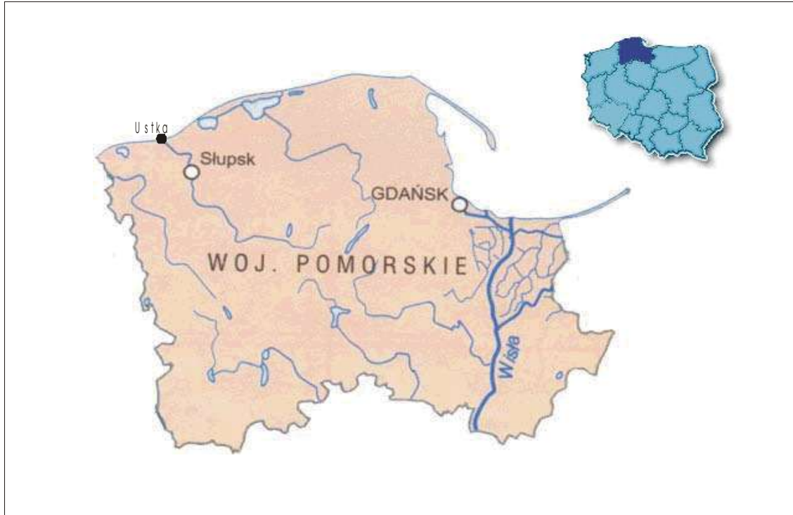
Rys. Położenie Ustki

Gmina Miejska Ustka położona jest u ujścia rzeki Słupi, 150 km na zachód od stolicy województwa – Gdańska i 18 km na północ od stolicy powiatu – Słupska. Swoją nazwę Ustka zawdzięcza właśnie położeniu przy ujściu Słupi (inne dawniej funkcjonujące nazwy to Stolpes Mundum, Stolpmünde, Nowy Słupsk, Uszcz lub Ujść, Postomin, Słupioujście). Nazwa „Ustka” została urzędowo ustalona w 1947 roku.